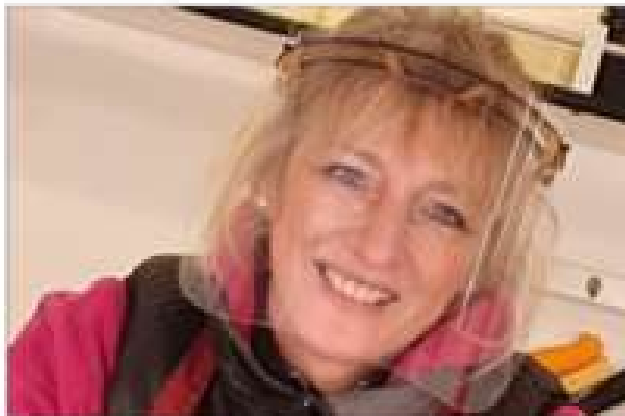
Près de 500 visières ont été offertes par le Rotary club de Sarrebourg.

Ces visières sont mises gracieusement à disposition par le Rotary Club de Sarrebourg. Elles visent à protéger la population saine, en complément des indispensables gestes barrières, face