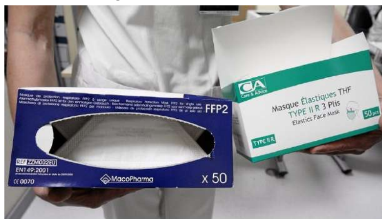
▲ La première commande devrait être livrée le 30 avril.

Le Rotary club de Béziers, association humanitaire, est engagé dans la lutte contre le Covid19, avec beaucoup d'autres, aux côtés de l'Etat et des collectivités territoriales. Grâce à son réseau international, il lui a été possible d'importer des masques et autres équipements de protection répondant aux normes des autorités de santé et de les proposer à des mairies, agglomérations, entreprises, clubs service ou associations du Languedoc.